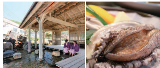
下田温泉では旬のアワビなどがふるまわれ、無料で楽しめる「足湯」もあります

●名湯・下田温泉について 下田温泉の開湯は700年前、全国でも珍しい希少性の高い「特殊温泉」に分類されています。切り傷や疲労回復に良いとされ、源泉の温度は51℃。「沸かさず薄めず循環せず」の純粋な天然温泉です