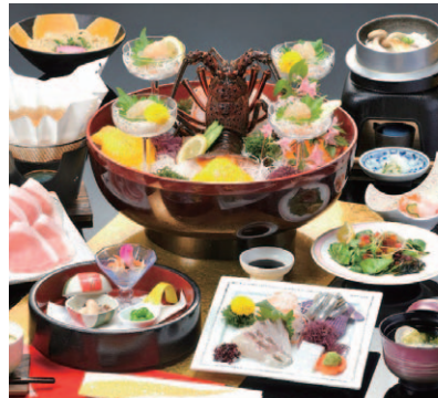
天草旅行の楽しみといえば、新鮮な魚介グルメ！(写真はキャンペーンの夕食例)

※料金は2人1室の場合 ※平日料金、休前日は2200円(税込)増し、別途入湯税150円がかかる施設もあり ※子ども料金は問合せ