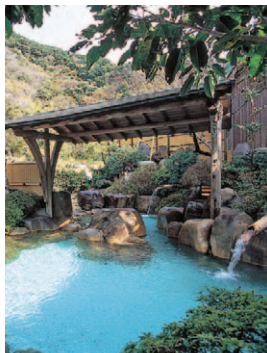
ツアーでは源泉かけ流しの温泉を露天風呂、内湯で楽しめます