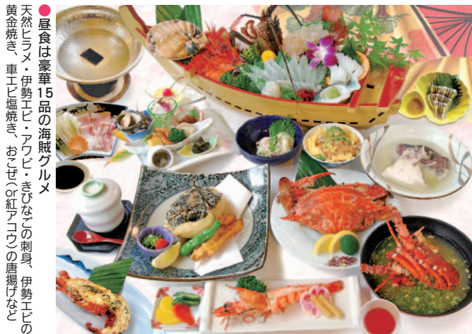
●昼食は豪華15品の海賊グルメ 天然ヒラメ・伊勢エビ・アワビ・きびなごの刺身、伊勢エビの黄金焼き、車エビ塩焼き、おせり(紅アコウ)の唐揚げなど