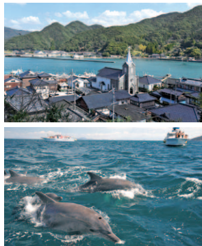
天草を代表する観光スポット、崎津集落とイルカウォッチング

申込みについて 申込み受付は12月23日(月)午前10時スタート、九州産交ツーリズムまでお電話ください！定員になり次第終了となりますのでお早めに。宿泊先はキャンペーンのホームページで確認ください。HPが閲覧できない場合は九州産交ツーリズムへ問合せを。